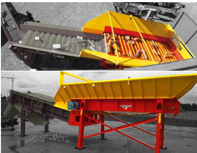
6 cubic meters buffering screener