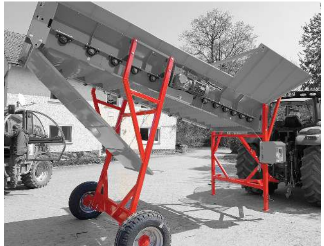
Stationary or rolling machine