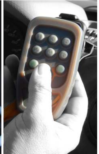
Radiocontrol for the electric version